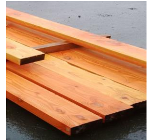
PLANCHE BRUT DOUGLAS (REP:020601100)