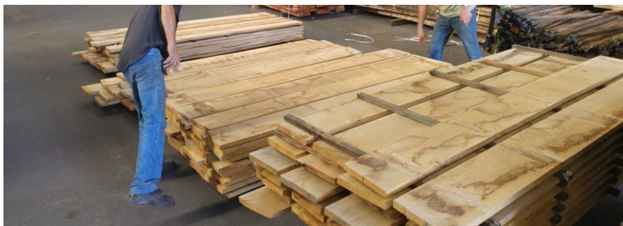
Qualités définies selon la Norme EN975-1