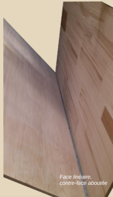
Face linéaire, contre-face aboutée