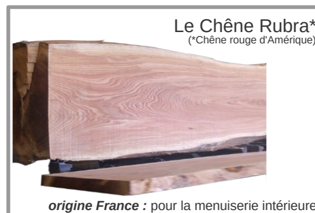
Le Chêne Rubra* (*Chêne rouge d'Amérique)

origine France : pour la menuiserie intérieure