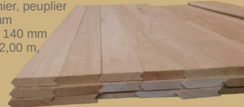
Illustration : lambris chêne « langue d'aspic » pour voûte d'église