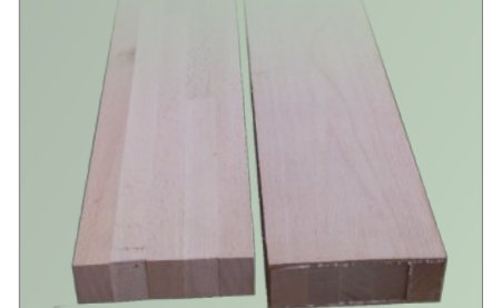
Montant de porte hêtre sans ou avec parement