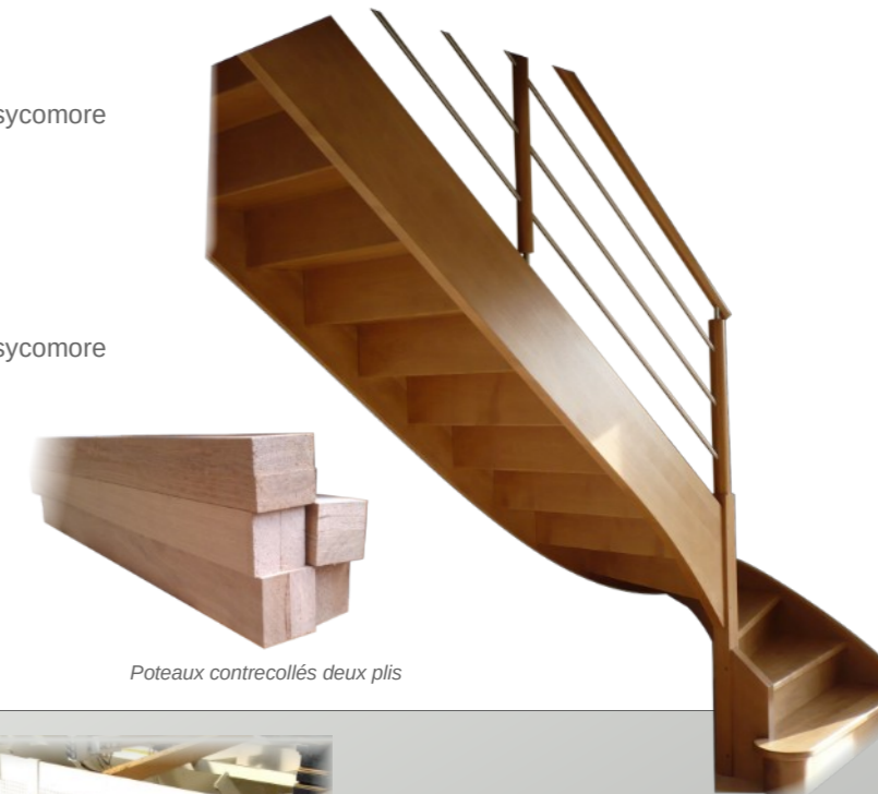
Poteaux contrecollés deux plis