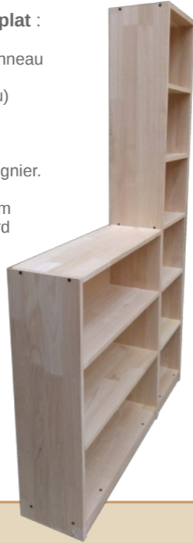
Meuble en panneaux de châtaignier aboutés