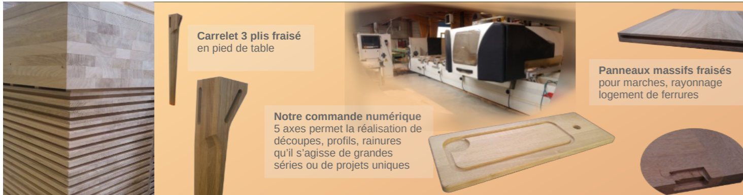
Carrelet 3 plis fraisé en pied de table

Notre commande numérique 5 axes permet la réalisation de découpes, profils, rainures qu'il s'agisse de grandes séries ou de projets uniques